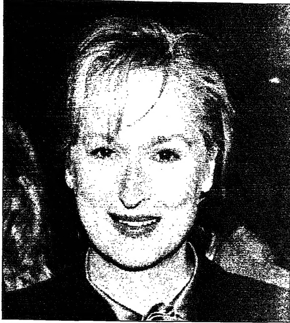
التميمة الامريكية ميل سترينج حضرت حفل العرض الاول لفيديها الجديد «شي» واحد حياقي في لوس انجليس ليلة امس الاول

اصغر سنا يتعاطون هرمونات مما قد يضرهم ايضا تشكل صحية. ويشهد الاخصائيون تعاطي حقن هرمونات نمو بشرية ومركبات هرمونية اخرى مثل (اندرستيرون) التي يتناولها مارك ماغواير بطر فريق (شاربينالز) للبيبول في سانت لوسيس. ويشكو الدكتور ستانلي فيلد من الجمعية الاكلينيكية الامريكية للتغذية التي ترشد اطباء تخصصوا في الهرمونات والتغذية من تناول نجوم الرياضة مكملات هرمونية. قال فيلد في حديث تلفوني مؤلفه اناس رياضيون عظام لهم بنية راسخة، ولكنهم يعانون من الاضرار في اجهزة اجسامهم.